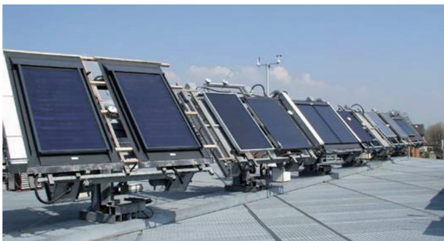
Nachführbare Tracker für Freilichtprüfungen