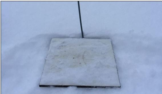
Bisheriges Messmittel: Neuschnee-Messbrett