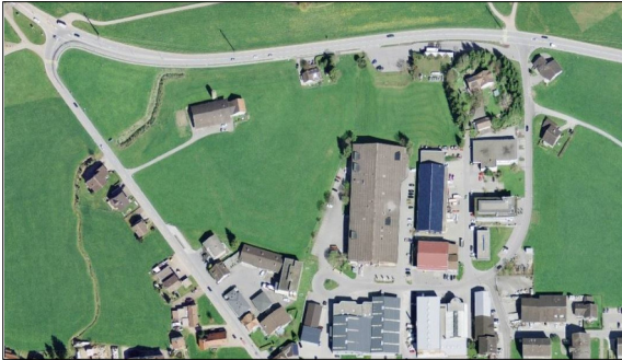
Abbildung 1: Ausgangslage

Ausgangslage: Im Westen des Dorfes Appenzell befindet sich das Industriegebiet Rüti mit einer Vielfalt an Unternehmenstypen. Der Auslöser des Bauvorhabens ist das Begehren zur Vergrösserung dieses Industriegebiets. Dazu soll die Wiese mit einem Bauernhof auf der Parzelle 398 (Hintere Rüti) erschlossen werden. Zurzeit ist diese Fläche mit einer Grösse von ca. 20'000m 2 im Besitz der Familie Dähler. Die nächste Generation möchte den Hof nicht weiterführen. Sie möchten alles bis auf das Wohnhaus verkaufen. Die bisherige und die zukünftig zu erwartende Entwicklung dieses Gebiets führen zu Mehrverkehr, welcher die bestehende Erschliessung über die Rütistrasse an das übergeordnete Strassennetz (Entlastungsstrasse) nicht gewährleisten kann.