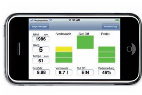
Momentanwertanzeige während der Fahrt

Ergebnis: Die realisierte iPhone EcoHelper App liest Fahrdaten (Geschwindigkeit, Motorendrehzahl, Mass Air Flow, Drosselklappenstellung etc.) via WLAN aus einem OBD-II-Adapter der Firma PLX-Devices. Höhenangaben (und weitere GPS-Werte) zur Fahrt werden vom iPhone-GPS-Empfänger übernommen. Aus diesen Daten werden die Fahrparameter Benzinverbrauch, Pedalstellung, Schubabschaltung, Ecozahl sowie der eingelegte Gang berechnet und in Echtzeit auf dem iPhone angezeigt. Alle Messwerte werden wahlweise während oder nach der Fahrt (über GPRS/3G oder WLAN) auf die EcoHelper-Webplattform www.tourlive.ch/ecohelper/ übertragen. Dort kann man die Fahrten via Browser analysieren. Mit der neuen iPhone App lassen sich nun statistische Daten und eine Beurteilung der Fahrweise auch lokal auf dem iPhone anzeigen. Die Funktionsweise der neuen iPhone-Applikation wurde für die Autos Toyota Rav4, Citroen C1, Alfa Romeo 156, Peugeot 306, Seat Ibiza und BMW 335d unter Beweis gestellt.