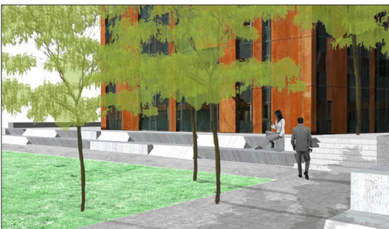
Sitzelemente entlang der westlichen Parkgrenze

Aufgabenstellung: Die Industriebrache Torfeld wird in den nächsten Jahren einen Umbruch erfahren. Im Gebiet ist eine Fläche für eine Parkanlage ausgewiesen, welche als einen für die Stadt Aarau notwendigen Freiraum zu gestalten ist.