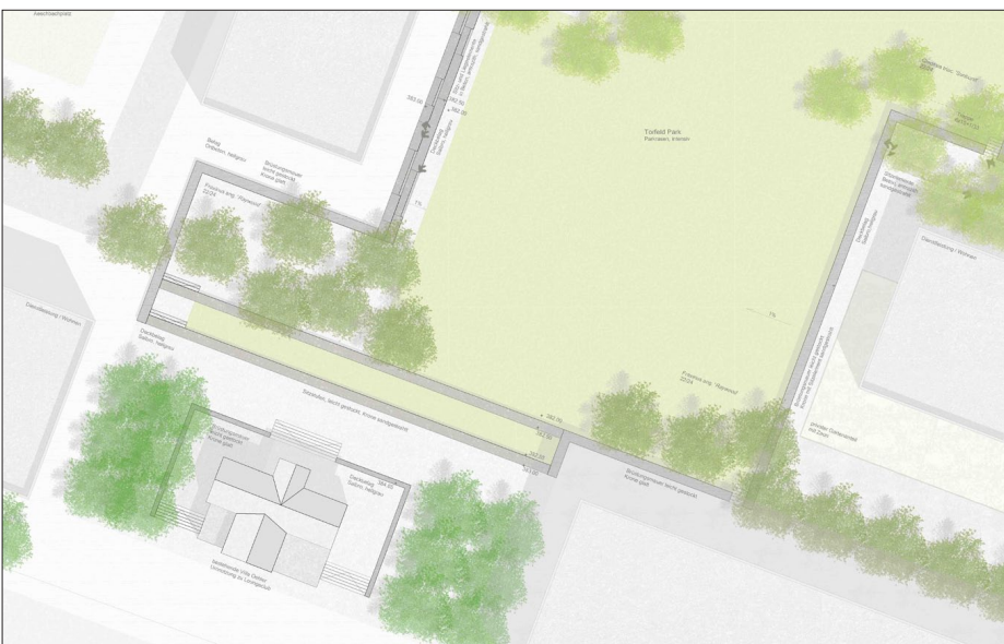
Planausschnitt Parkeingang Villa Oehler

Fazit: Die Parkanlage ist durch die eigene räumliche Fassung ohne umschliessende Bebauung ein eigenständiges Objekt. Der Park kann mit dem ersten Ausbau im Torfeld erstellt werden und begünstigt einen Initialeffekt für das Gebiet Torfeld.