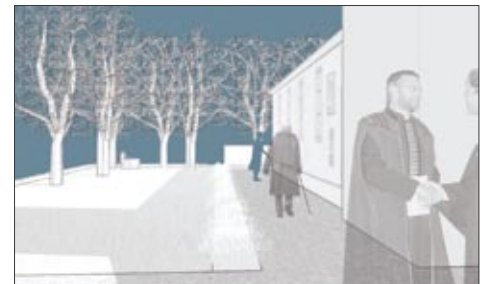
Nach dem Gottesdienst