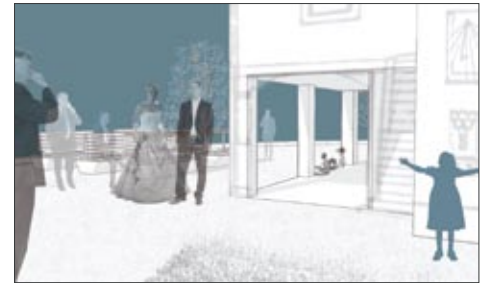
Hochzeits-Apéro auf dem Vorplatz