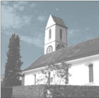
Kirche Ellikon an der Thur

Aufgabenstellung: Gemäss ISOS ist der Kirchenhügel in Ellikon einer der schönsten im Kanton Zürich. Die Zeit hat jedoch sichtbare Spuren hinterlassen. Die Bäume sind zu stark gewachsen, die Grabfelder werden aufgehoben und ein erkennbares Gestaltungskonzept fehlt.