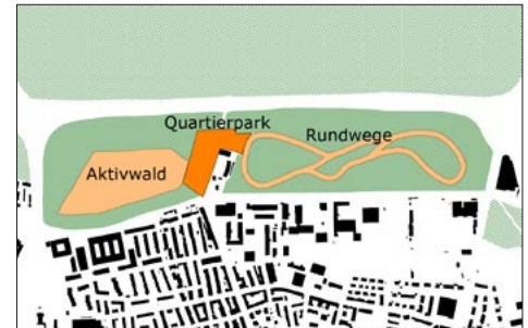
Die drei Nutzungsbereiche