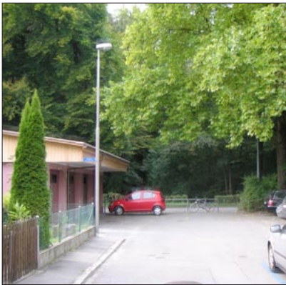
Das Quartier grenzt direkt an den Waldrand mit vielen alten Bäumen

Aufgabenstellung: Das zentrumsnahe Berner Quartier Länggasse besitzt eine hohe Wohnumfeldqualität. Es gibt jedoch keinen Quartierpark und keine grosszügigen Freiräume in der Nähe. In dieser Arbeit wird ein Konzept für den Länggasswald zur Nutzung als Quartierpark vorgeschlagen.